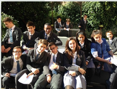
Alumnos 1ºESO en el jardín arqueobotánico

En este sentido, el museo nos aporta valiosa información sobre los ajueros funerarios , la importancia de la muerte y la creencia en el más allá, destacan