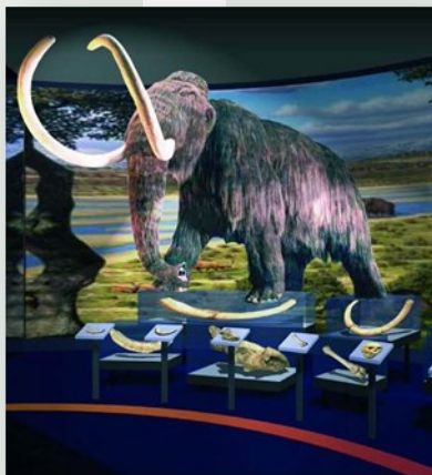
Sala del Paleodioxodon antiquus o sala del mamut

Madrid tuvo un pasado remoto, poco conocido, un Madrid Prehistórico , por ese motivo el lugar elegido en nuestra primera visita, fue el Museo de los Orígenes de Madrid, antiguo Museo de San Isidro . En su colección permanente, destacan las salas dedicadas a la arqueología madrileña y a la historia de la ciudad desde la Prehistoria hasta el establecimiento de Madrid, Villa y Corte en el año 1561.